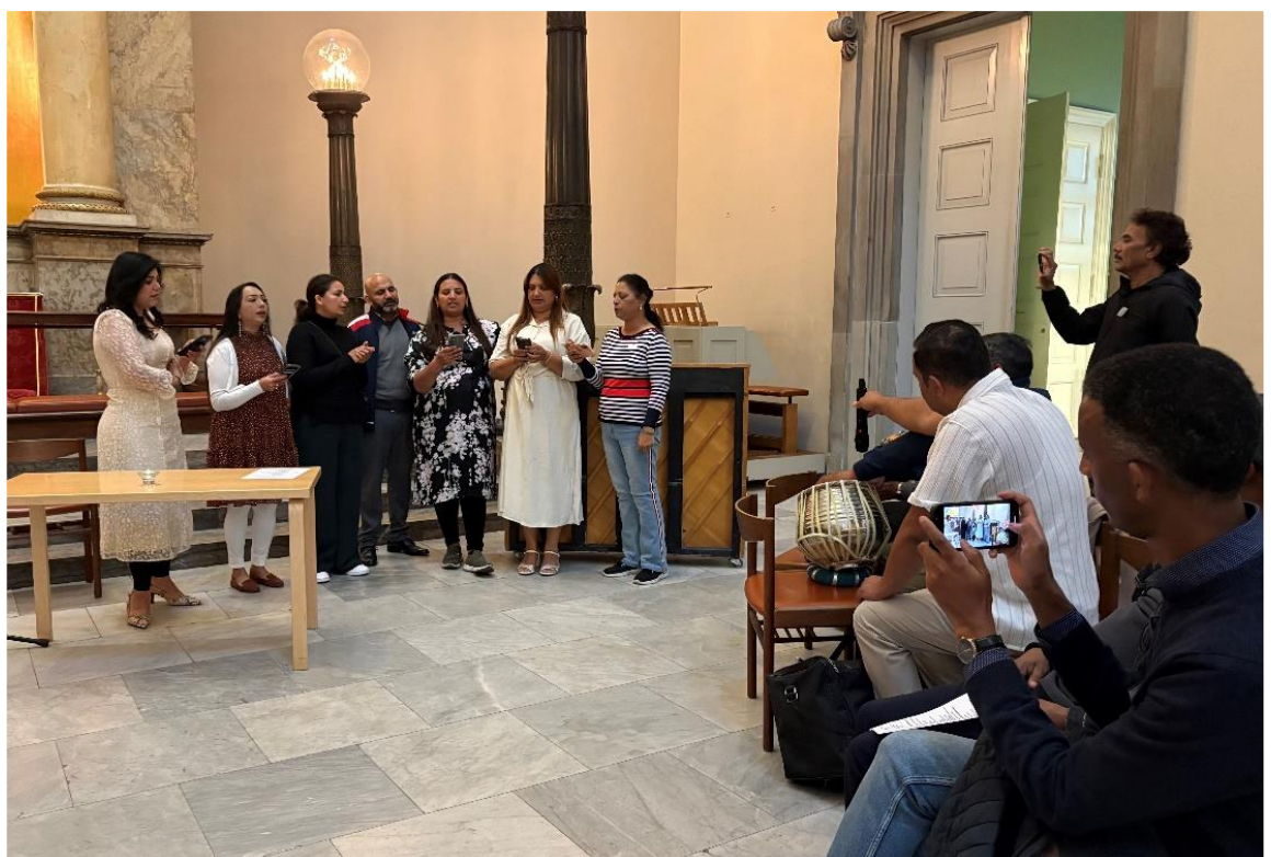
Medlemmer af Den Pakistanske Menighed sang en lovsang på urdu.