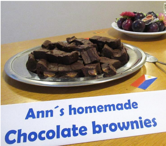
hjemmelavede kinesiske månekager og Anns brownies