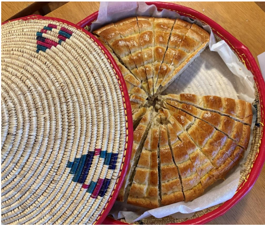
Kaffebordet bød på Himbasha, etiopisk/ eritreisk brød,